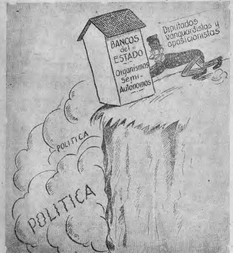
Varios diputados vanguardistas y opositores siguen empeñados en empujar al barranco de la política a organismos que hasta el momento se habían mantenido alejados de ella, como son los Bancos del Estado y las Juntas semi-autónomas

Sin embargo, no existe todavía plan alguno, científicamente elaborado, que puede llevarse a la práctica en la lucha contra el temible acrido y las sumas que la Secretaría de Agricultura recibirá para invertir en la lucha contra el voraz insecto, son claramente insuficientes, dada la magnitud que las manadas de chapulines han alcanzado en el presente año, llegando a cubrir, casi en su totalidad, las más ricas y productivas zonas agrícolas de la provincia de Guanacaste, Puntarenas y partes de las de Alajuela. Es criterio de algunos entendidos en esta materia, que no podrá ser posible llevar a cabo en el presente año, sino hasta en el próximo, campaña alguna de verdadera significación para combatir esta plaga y es opinión muy generalizada entre los agricultores, que deberá aprovecharse este año para elaborar un plan bien meditado y disponer los medios mecánicos y químicos indispensables para el buen éxito de la gigantesca labor que esa Secretaría deberá realizar, para que se obtenga buen éxito en esta próxima batalla.