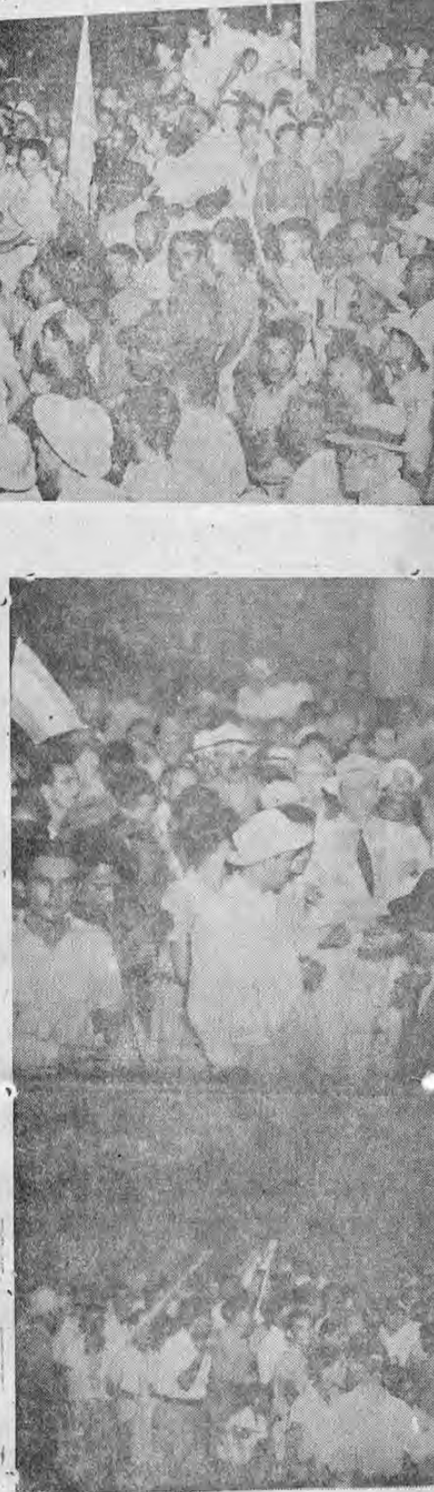
Las gráficas recogen diversos aspectos del Puntarenas, calderonista en un noventa por ciento futuro presidente de Costa Rica, doctor don Rafael Angel Calderón Guardia se trasladó desde la estación poco después la reunión más grandiosa que

El Partido de Oposición no existe, lo único que existe es un grupo de alocados ulatistas que creen y apoyan la obsesión de su Jefe, de que tiene que ser Presidente.